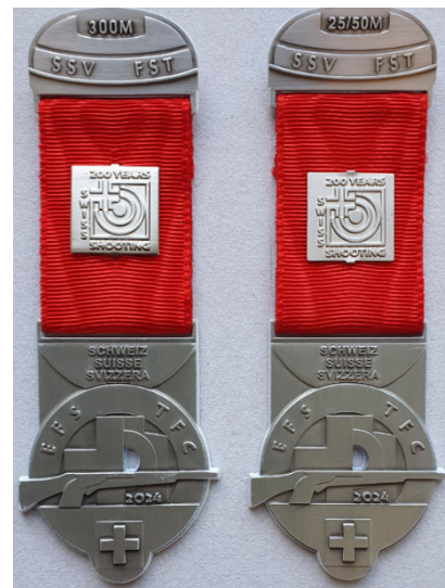
Spezialausgabe 200 Jahre SSV