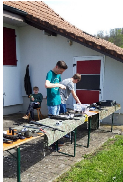
Gewehrreinigung nach jedem Training